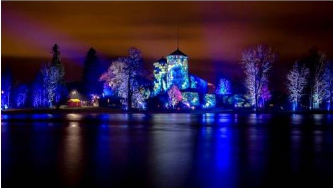
Kuva: Aapo Repo